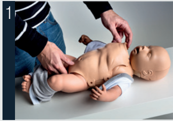
1 Retirer la peau du torse.