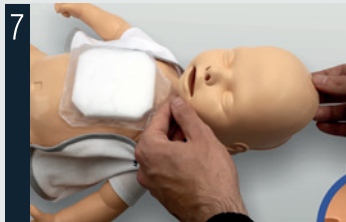
7 Placer la peau du visage et vérifier que le nez, la bouche et la languette supérieure s'emboîtent correctement.