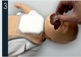
3 Passer le poumon par dessous la mâchoire.