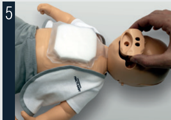
5 Bien emboîter la valve.