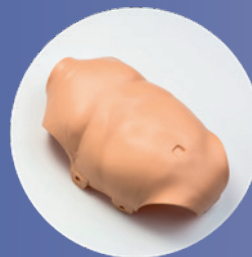
PEAU DU TORSE (Ref. Chest-PB)