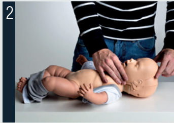
2 Retirer la peau du visage.