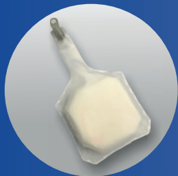
POUMON (Ref. SP-001 (PB))