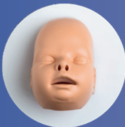
PEAU DU VISAGE (Ref. Face-PB)