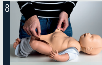
8 Placer la peau du torse.