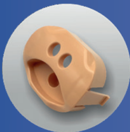
VALVE (Ref. SP-002 (PB))