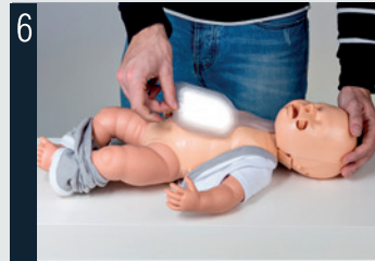
6 Placer le poumon sur la poitrine.